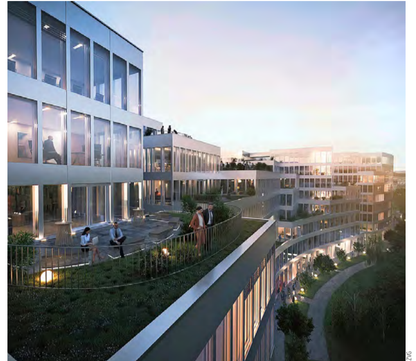
Terrassenlandschaft: Eine Vielfalt von Terrassen auf den Dächern des Circle bieten besonderen Raum für Restaurants und Events.