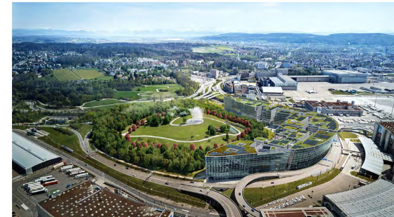
Grüne Lunge: Zum Circle gehört auch ein 80 000 Quadratmeter grosser Park.

Am 5. November eröffnet das Hotel Hyatt Regency Zurich Airport, dann wird Anfang 2021 das Hyatt Place dazukom-