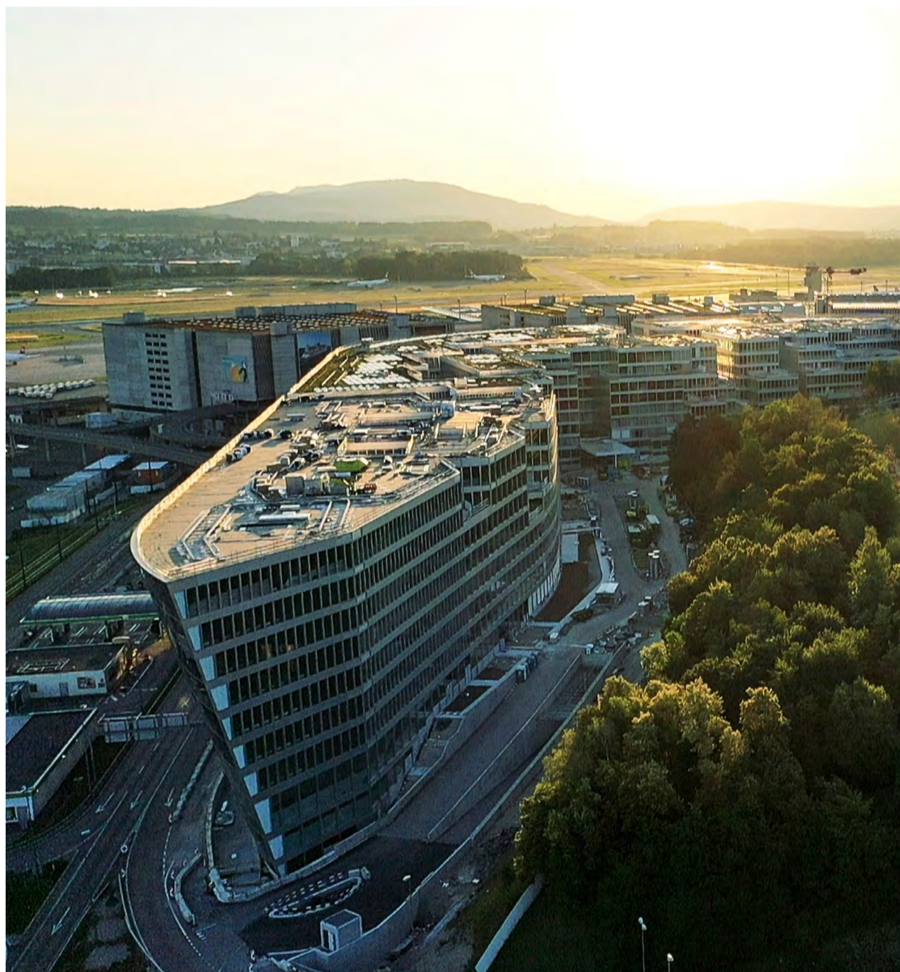
Eröffnung: Anfang November öffnet The Circle am Flughafen Zürich. 70 000 Quadratmeter Bürofläche und ein breiter Nutzungsmix setzen neue Massstäbe.