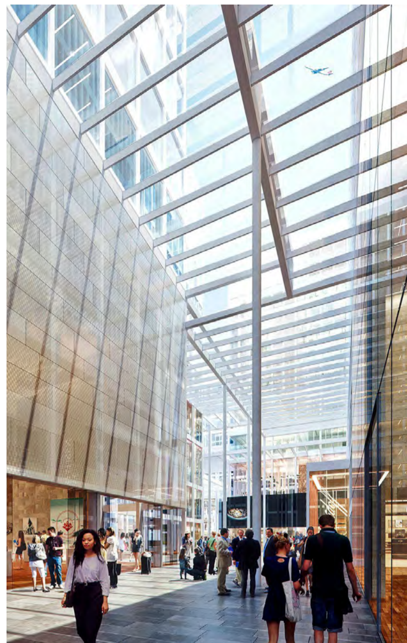
Treffpunkt: Der Circle vereint Einkaufen, Kultur, Kunst, Bildung, Gastronomie, medizinische Versorgung, Arbeiten und Hotellerie unter einem Dach.