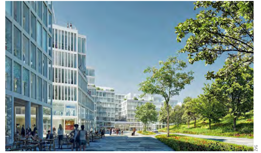
Freie Büros: Die letzten Möglichkeiten für Mieterinnen und Mieter gibt es in Haus 16.

Fernab vom Alltagsstress und der Flughafenhektik kann man sich direkt am Airport im Fitnesszentrum sportlich engagieren oder sich in der 2000 Quadratmeter grossen Wellnessoase erholen. Das Angebot umfasst ein orientalisches Dampfbad, einen Hamam sowie verschiedene Saunas. Auch im Trampolin-, Freestyle- und Actionpark Flip Lab, in der Nähe des