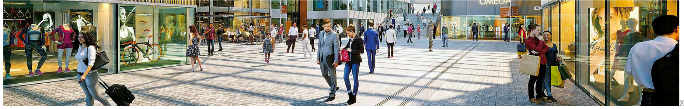
Shopping-Paradies: Zum Einkaufen laden 25 Brandhouses ein, in denen weltbekannte Marken interaktiv entdeckt und erlebt werden können.